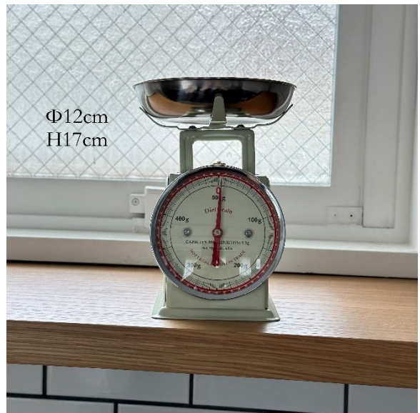
4-12 キッチンスケール (¥550)