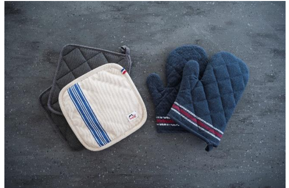
4-26 鍋敷き オープンミトン