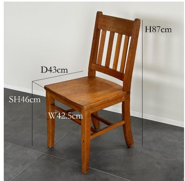
4-02 ダイニングチェア (¥1,100)